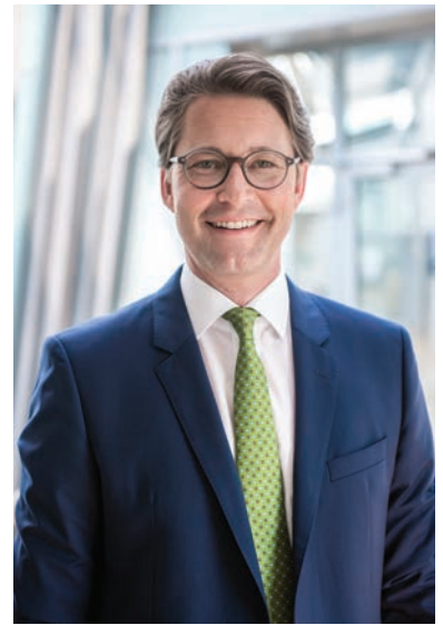
Andreas Scheuer MdB Bundesminister für Verkehr und digitale Infrastruktur