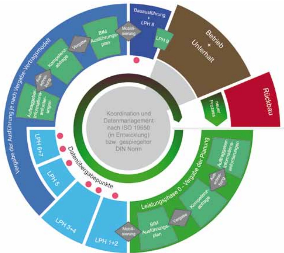
Abbildung 2: Schematische Darstellung des BIM-Referenz-Prozesses (planen-bauen 4.0 GmbH)

Die AIA zu Beginn des Projekts (grüner Bereich) können bereits teilweise auf der Anwendung von BIM basieren, da Visualisierungen dem Auftraggeber helfen können, die von ihm präferierte Projektvariante auszuwählen.