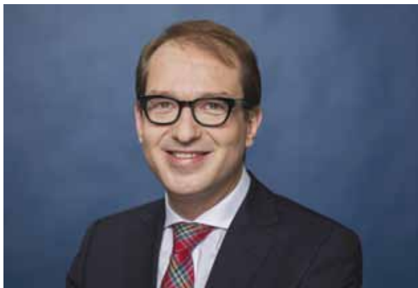
Alexander Dobrindt MdB Bundesminister für Verkehr und digitale Infrastruktur

Die Digitalisierung ist eine Substanzrevolution von Wirtschaft und Gesellschaft. Sie verändert die Voraussetzungen für das Wachstum, den Wohlstand und die Arbeit von morgen – und revolutioniert in einem disruptiven Prozess Industrien und Dienstleistungen, Wertschöpfungsketten und Produktionsprozesse, Innovations- und Produktlebenszyklen.